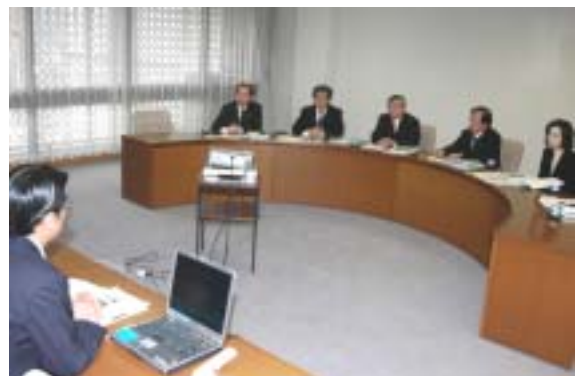
大阪市で条例を基に自転車の盗難防止を進める市民(上) 大分市で条例について聞く公明党福岡県議団(下)